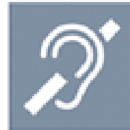
Sourd et malentendant