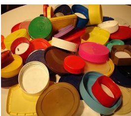
Mauvais bouchons: couvercles en plastique