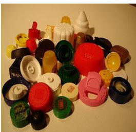
Mauvais bouchons: denrées alimentaires