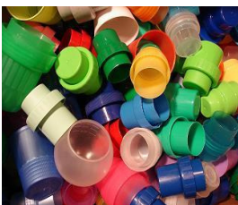
Mauvais bouchons: produits lessives