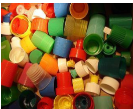
Mauvais bouchons: détergents