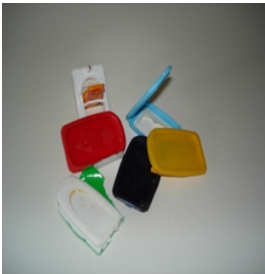
Mauvais bouchons: fermeture plastique de Tetra Brik