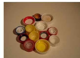
Mauvais bouchons: doubles bouchon